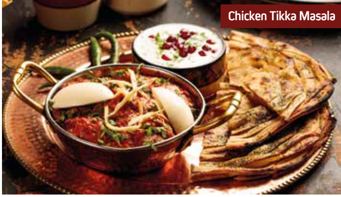
Chicken Tikka Masala

Vegetable dumplings in a rich mughlai gravy زلية نباتية في مرق موغلاي الغني